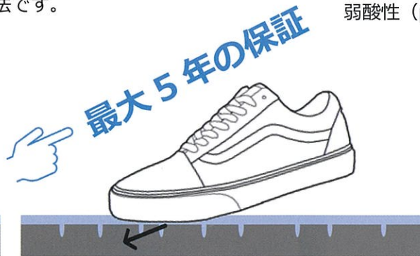
微細な穴に水を押し込み水の移動を抑えるので滑らない