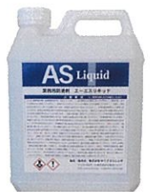
浴場用 ASリキッド 酸性

主な採用案件： 商業施設・公共施設・寺社仏閣・小学校・民間企業・マンション・セレモニーホール 主な採用箇所： エントランス・大浴場・トイレ・店舗内・プールサイド・駅・高速道路SA 累計施工実績： 218,508㎡ (2022/8/31) 現在 対象床材： 磁器質タイル・陶器質タイル・セラミックタイル・御影石他石材