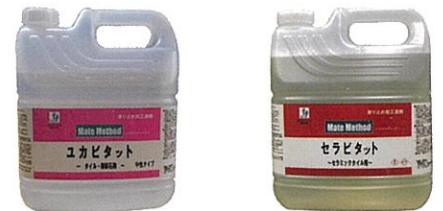
タイル・石用 ユカビタット 弱酸性 (pH4.5) セラミックタイル用 セラビタット 弱酸性 (pH5.5)

物理的に穴がある限りは効果は持続しますが、油膜状の汚れがあると一時的に穴をふさぎ、汚れで滑ります。年数回は洗剤、ポリッシャーを使用した洗浄を行うと効果が持続します。尚、ASL工法はSGS（スリップ・ガード・システム）の後継工法です。